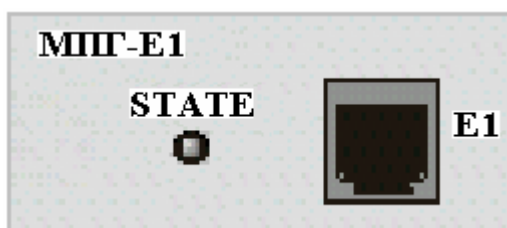
Рис.1. Вид передней панели модуля МПГ-Е1.

Внешний вид передней панели модуля приведен на рисунке 1.